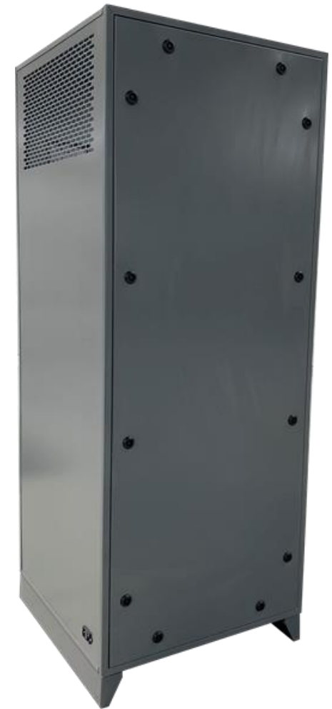
Rückansicht mit Revision