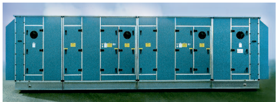
Ex-Schutz-RLT-Gerät HOWATHERM System ETA atexProTec