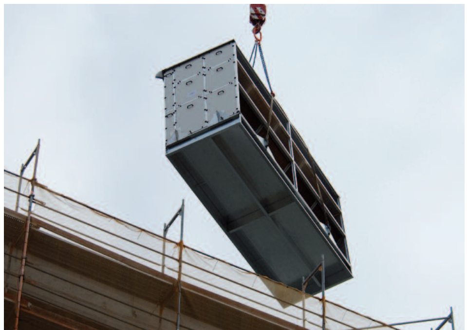
Krantransport des Teilsegments eines Dachgeräts für das Städtische Klinikum Offenbach